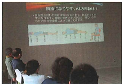
5月25日 褥瘡と対策について