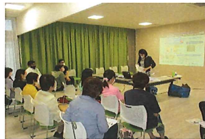
6月9日 感染予防に配慮した排せつケア