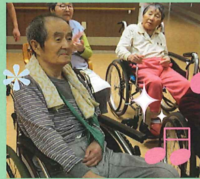
みんなで健康王国でカラオケです