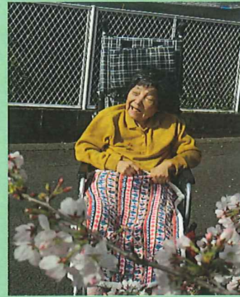
苑の近くにお花見にいきました。