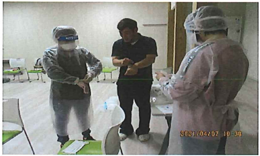
4月7日 個人防護具の着脱の順序