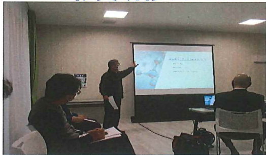
2月25日 光触媒コーティング施行について