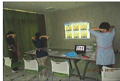
6月24日 感染対策研修と実践訓練