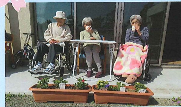
みんなでひなたぼっこ