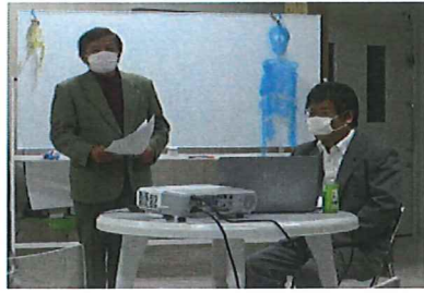
10/26 メンタルヘルスマネジメントスキルの向上