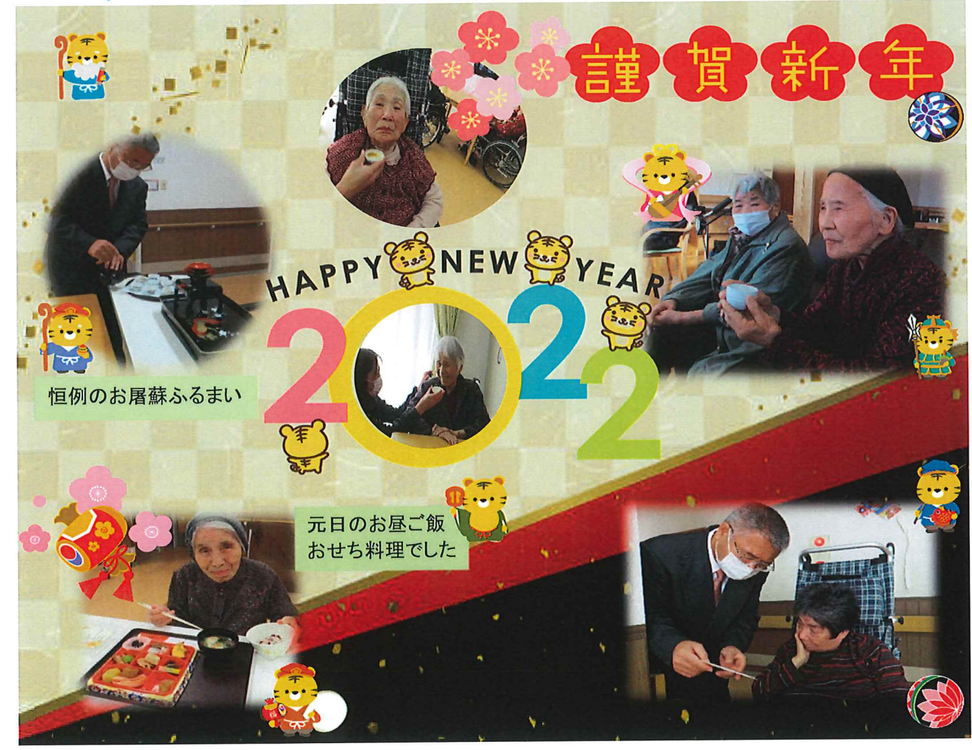
恒例のお屠蘇ふるまい