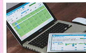
カレンダー表示機能

それぞれのサービス向けの各種計画書の作成と管理も可能です。 一部の計画書には更新管理機能があり、更新時期を知らせるアラーム表示により計画書の更新漏れを防ぐことができます。