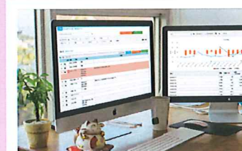
わかりやすい記録の閲覧・集計画面

記録項目を自由に設定し、タッチ入力・音声入力・バーコード入力、QRコード入力など、いろいろな方法で簡単に入力できます。 基本的な記録内容は選択肢により入力し、補足内容はテキスト(音声入力可能)により入力する運用が可能です。