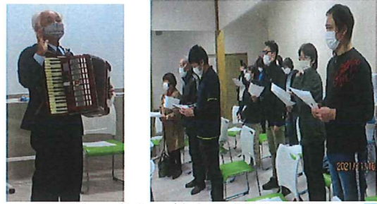
11/16 「人の輪をつくる和の心」