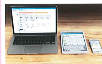
かんたんに記録できる

記録項目を自由に設定し、タッチ入力・音声入力・バーコード入力、QRコード入力など、いろいろな方法で簡単に入力できます。 基本的な記録内容は選択肢により入力し、補足内容はテキスト(音声入力可能)により入力する運用が可能です。