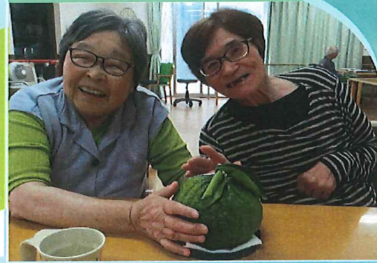
職員が持ってきたうべと大きな柚子です。