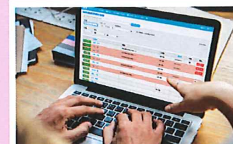
計画書の管理機能

利用者申し送り用とスタッフへの連絡用の2つの掲示板や個別のスタッフ間のメッセージ機能によりスタッフ間のスムーズなコミュニケーションを実現します。 ホーム画面の新着情報表示機能や未読、既読、コメント数表示機能により記憶された情報を漏らさず確認することができます。