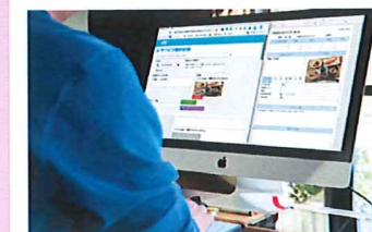
記録データの出力・各種帳票の作成

記録を時系列で閲覧することができます。特記項目のカラー表示やグラフ表示など、見やすい画面で記録を閲覧できます。 検索や絞り込み機能により、必要な情報をすぐに見つけることができます。