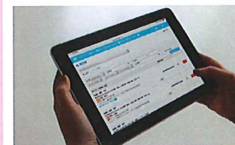
使いやすい申し送り機能

サービス提供記録、業務日報、経過記録、月間報告書など記録した内容から各種帳票を作成し出力することができます。 記録データをExcelやCSVデータで出力できるのでデータの分析や書類の作成などに自由に活用できます。