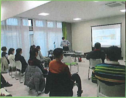
3/10 介護・福祉分野における業務効率化から導く利用者満足度upと利用者獲得の営業手法