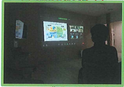
2/14 スマート農業と球磨農業の可能性