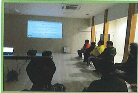
2/25 介護現場におけるハラスメントに関する職員研修